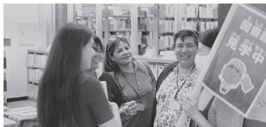
バスツアーの様子

令和5年9月17日に協働まちづくり課主催の、市内公共施設を巡る外国人向けのバスツアーの見学場所のひとつに図書館が選ばれた。館内見学のほか、利用登録も行ったが、用意した記入例や利用説明のボードを活用したところ、対応をスムーズに行うことができた。同伴の日本語教室の先生からも非常に好評だった。