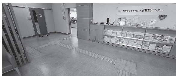
センター内には、点字ブロックを設置

視覚に障害がある人にとって大きなハンディとなるのが、情報収集である。人は、情報の多くを視覚から得ていると言われている。「情報」と一口にいっても多種多様であるが、文字情報へのアクセスが困難な状況は、学習や就業、家事全般はもとより、読書・趣味・余暇活動など日常生活において多くの支障をきたすことから、視覚障害＝情報障害とも言われる。従って、視覚障害者の社会的自立のため各地で設立が望まれたのが点字図書館や点字出版施設であった。