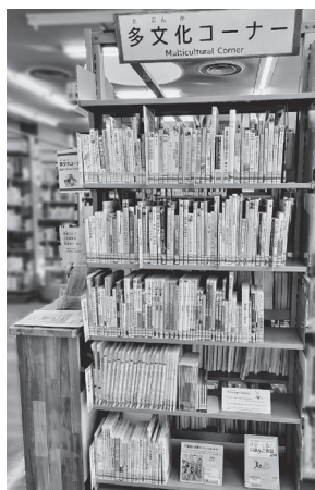
現在の多文化コーナーの様子（令和6年度）

所蔵数は約240冊である。また、コーナーの本や図書館を紹介する「多文化コーナー資料案内」を隔月で作成し、市役所や市内日本語教室で配布している。