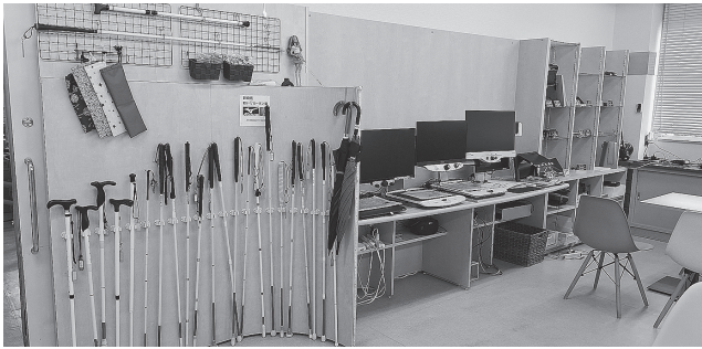
白杖、拡大読書器などの用具販売コーナー

今年度から貴会の一員に入れていただくことで、当館職員の資質の向上を図るとともに、会員施設の皆様に当館の存在や事業を知っていただき、相互に交流、活用できればと考えている。