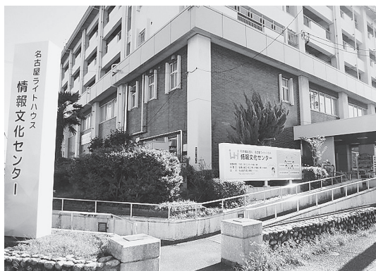
情報文化センターの外観（令和6年度）

当館は、社会福祉法人名古屋ライトハウスが運営する、視覚障害者等を主な対象とする福祉施設である。身体障害者福祉法に基づく「視聴覚障害者情報提供施設」の内の「点字図書館」、「点字出版施設」の機能を有し、視覚に障害があることによる様々なハンディの解消に向けてサービスを展開すべく、下記3つの事業部で業務を行っている。